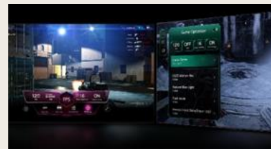
TABLEAU DE BORD & OPTIMISEUR DE JEU

L' intelligence artificielle s'invite dans votre interface webOS. Avec LG ThinQ , commandez votre téléviseur à la voix, que ce soit pour trouver votre prochain contenu à regarder en fonction de vos goûts, pour contrôler les objets connectés de votre foyer ou encore pour faire une requête à votre AI ChatBot .