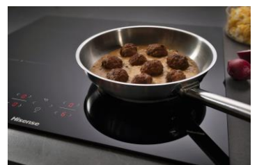
TABLE DE CUISSON À INDUCTION : HISENSE HI6421BSC